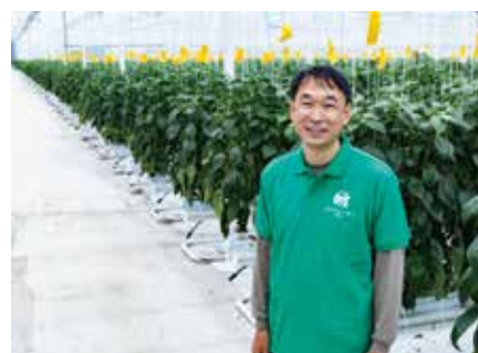
弊社にて設計、施工した株式会社Tedy様 ( https://www.tedy.jp/ )の次世代施設園芸にて

NTTグループである弊社は、地域の皆さまとともに歩ませていただく企業です。チャレンジングな事業ですが、弊社であるからこそ担える領域があると信じて前に進んでいきたいと思えます。「競争」ではなく「共創」の精神で、新しいコトを皆さまと生み出してまいります。皆さまのご指導ご鞭撻をいただきながら、日本の農業のため、そして世界をめざして精進していきますので宜しくお願いいたします。